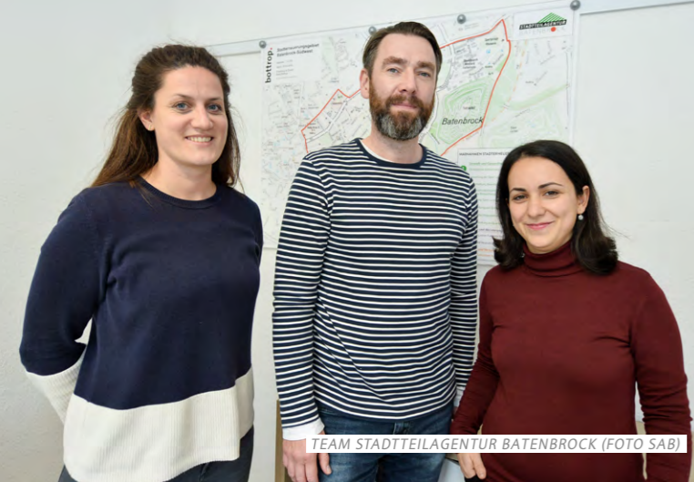
TEAM STADTTEILAGENTUR BATENBROCK