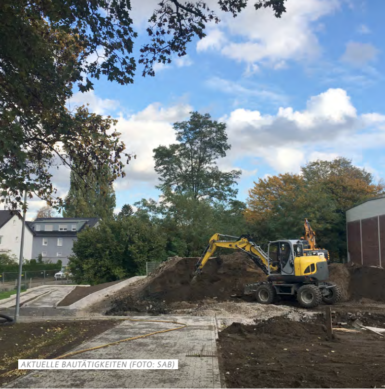
AKTUELLE BAUTÄTIGKEITEN