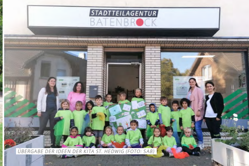
ÜBERGABE DER IDEEN DER KITA ST. HEDWIG