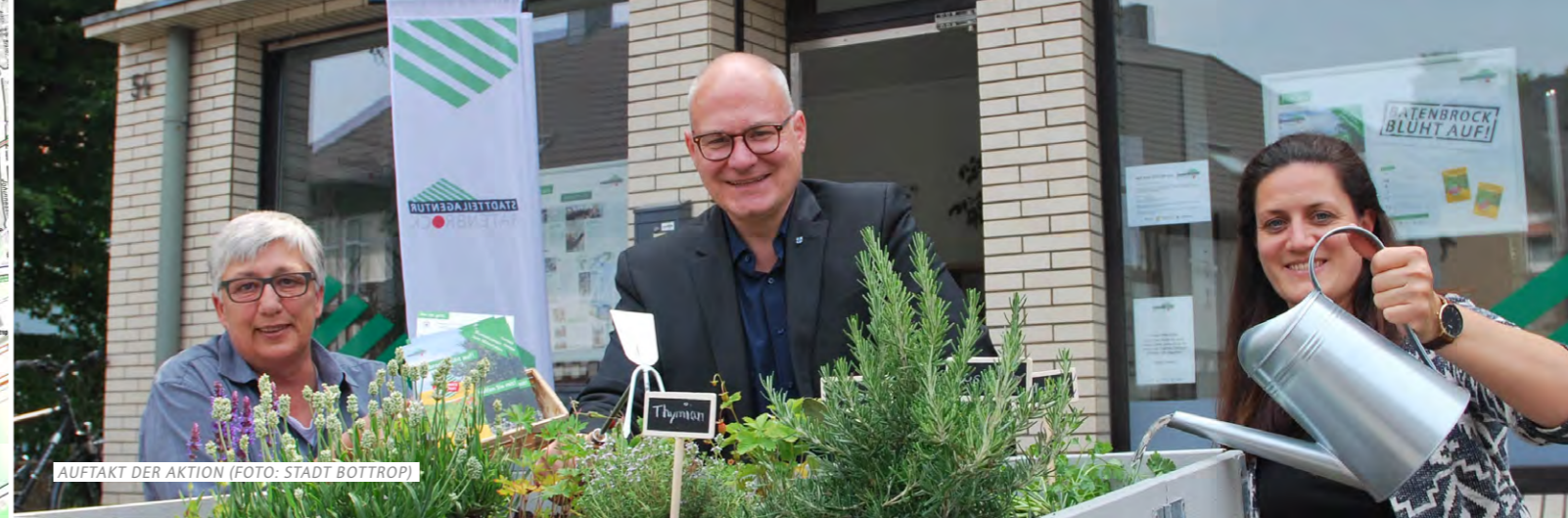
AUFTAKT DER AKTION