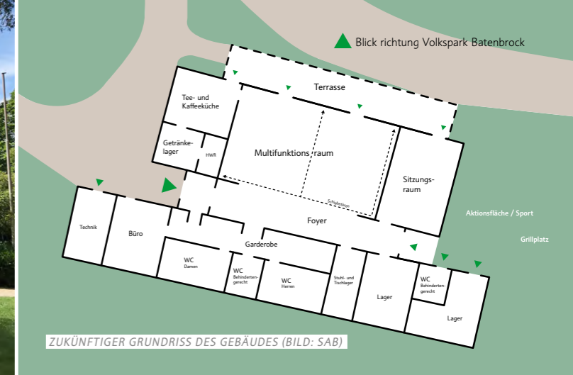
ZUKÜNFTIGER GRUNDRISS DES GEBÄUDES