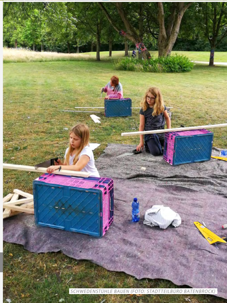
SCHWEDENSTÜHLE BAUEN

IHRE IDEEN WERDEN GESUCHT, SPRECHEN SIE UNS AN!