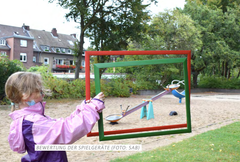
BEWERTUNG DER SPIELGERÄTE