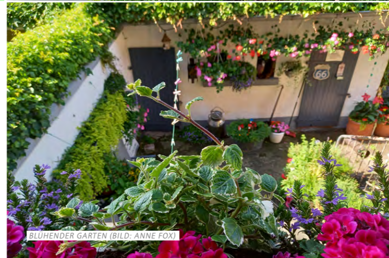
BLÜHENDER GARTEN

Das Projektgebiet Batenbrock-Südwest liegt südlich der Horster Straße, nördlich der Devensstraße sowie östlich der Friedrich-Ebert-Straße und westlich der Bahnlinie.