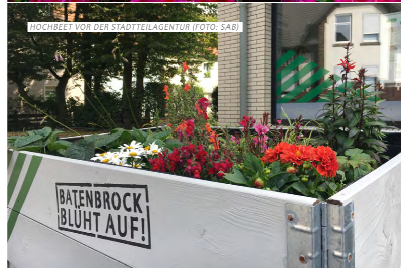
HOCHBEET VOR DER STADTTEILAGENTUR