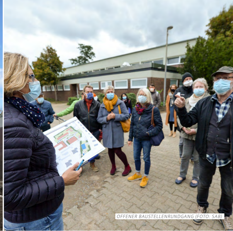
OFFENER BAUSTELLENRUNDGANG