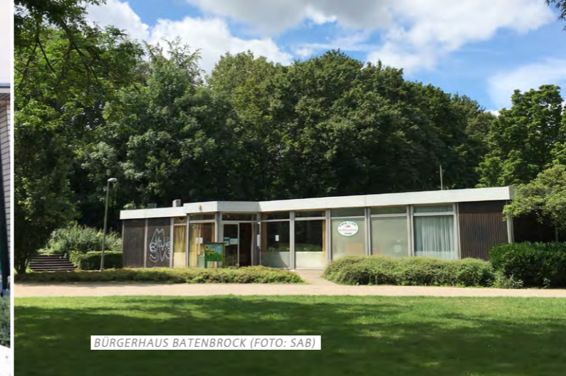
BÜRGERHAUS BATENBROCK