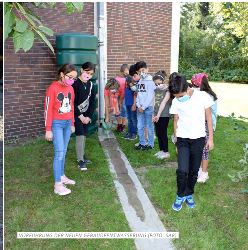
VORFÜHRUNG DER NEUEN GEBÄUDEENTWÄSSERUNG

Die Bauprojekte werden durch den Europäischen Fonds für regionale Entwicklung (EFRE) sowie aus Mitteln des Bundes, des Landes Nordrhein-Westfalen und der Stadt Bottrop finanziert.