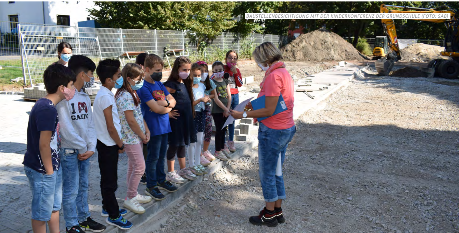
BAUSTELLENBESICHTIGUNG MIT DER KINDERKONFERENZ DER GRUNDSCHULE